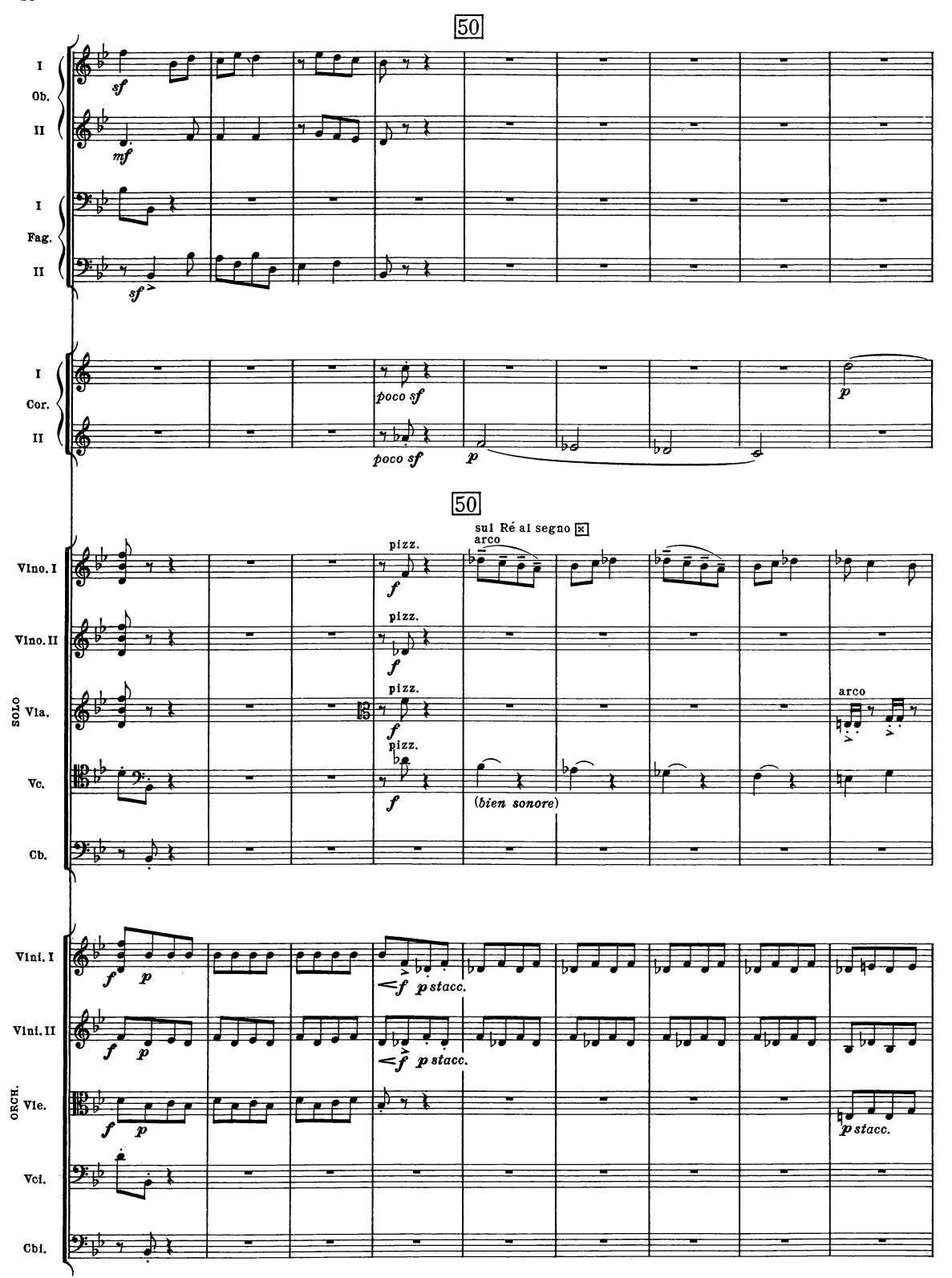
B. & H. 19362