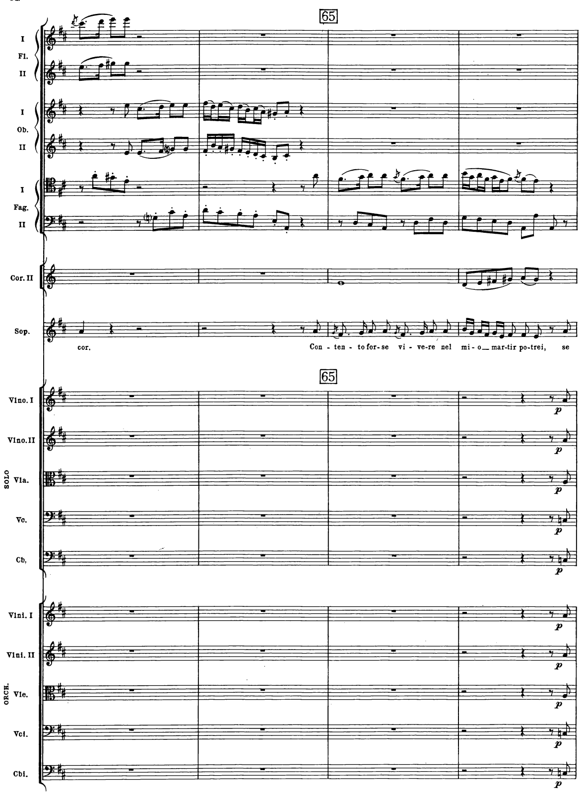
B. & H. 19362