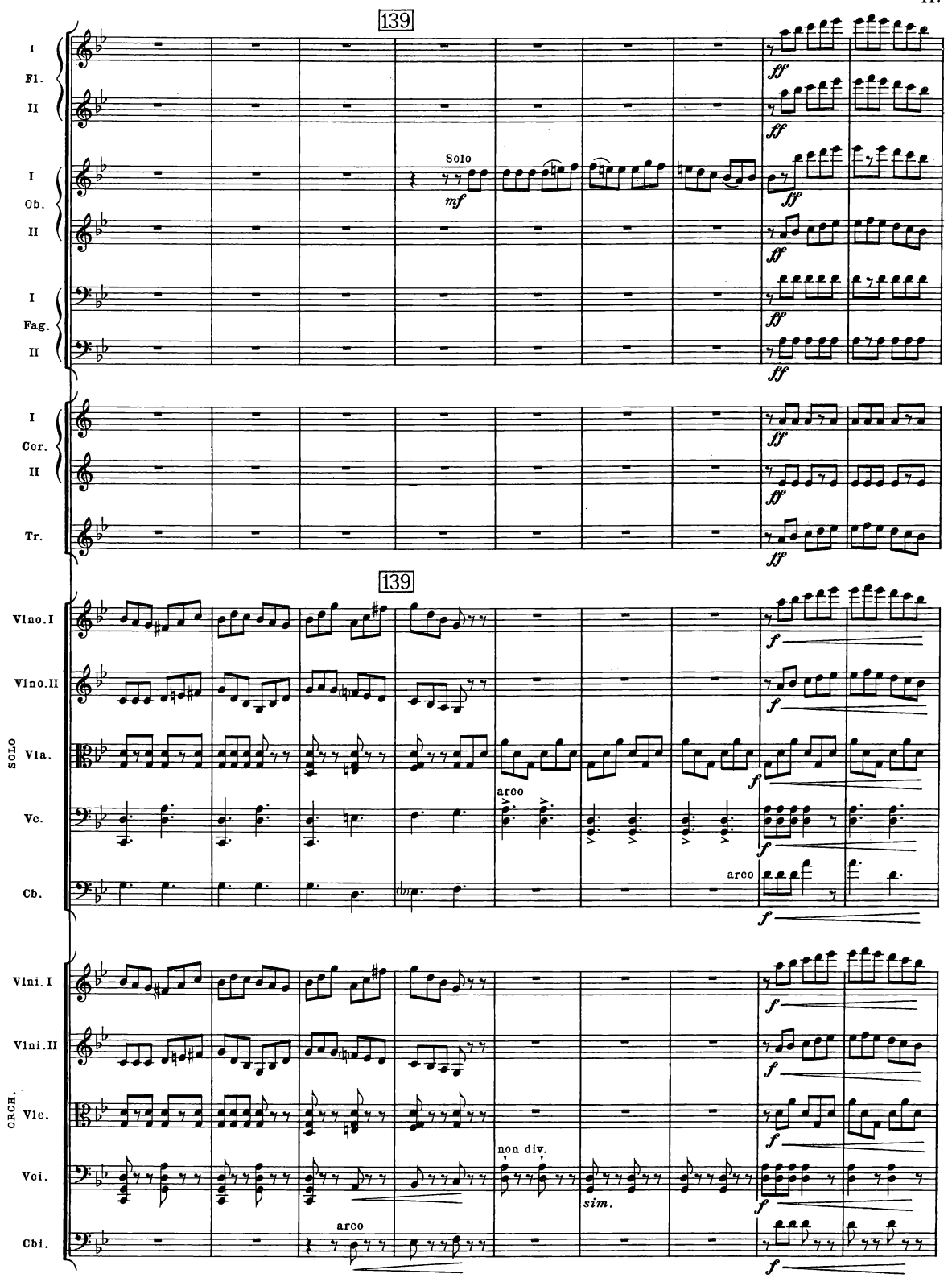
B. & H. 19362