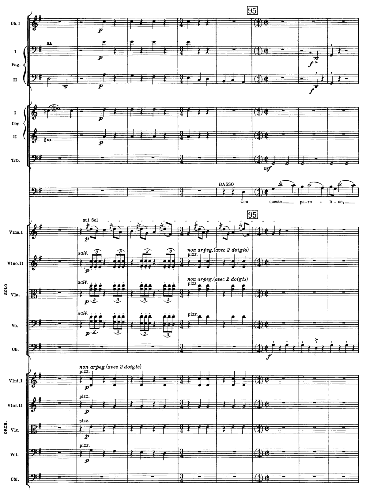
B. & H. 19362