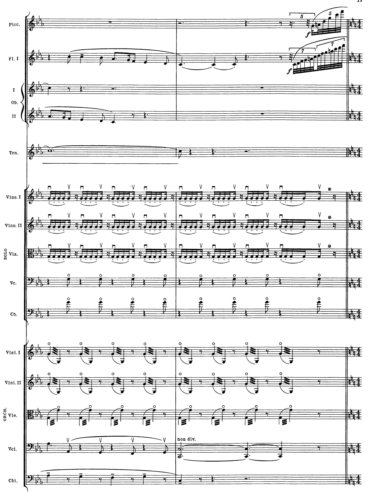
B. & H. 19362