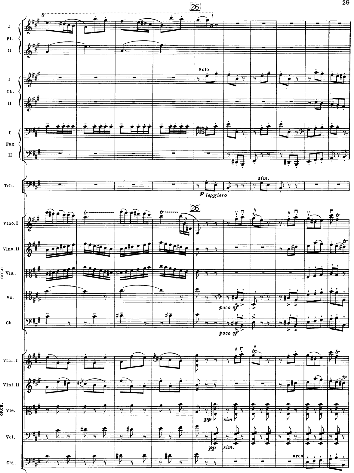
B. & H. 19362