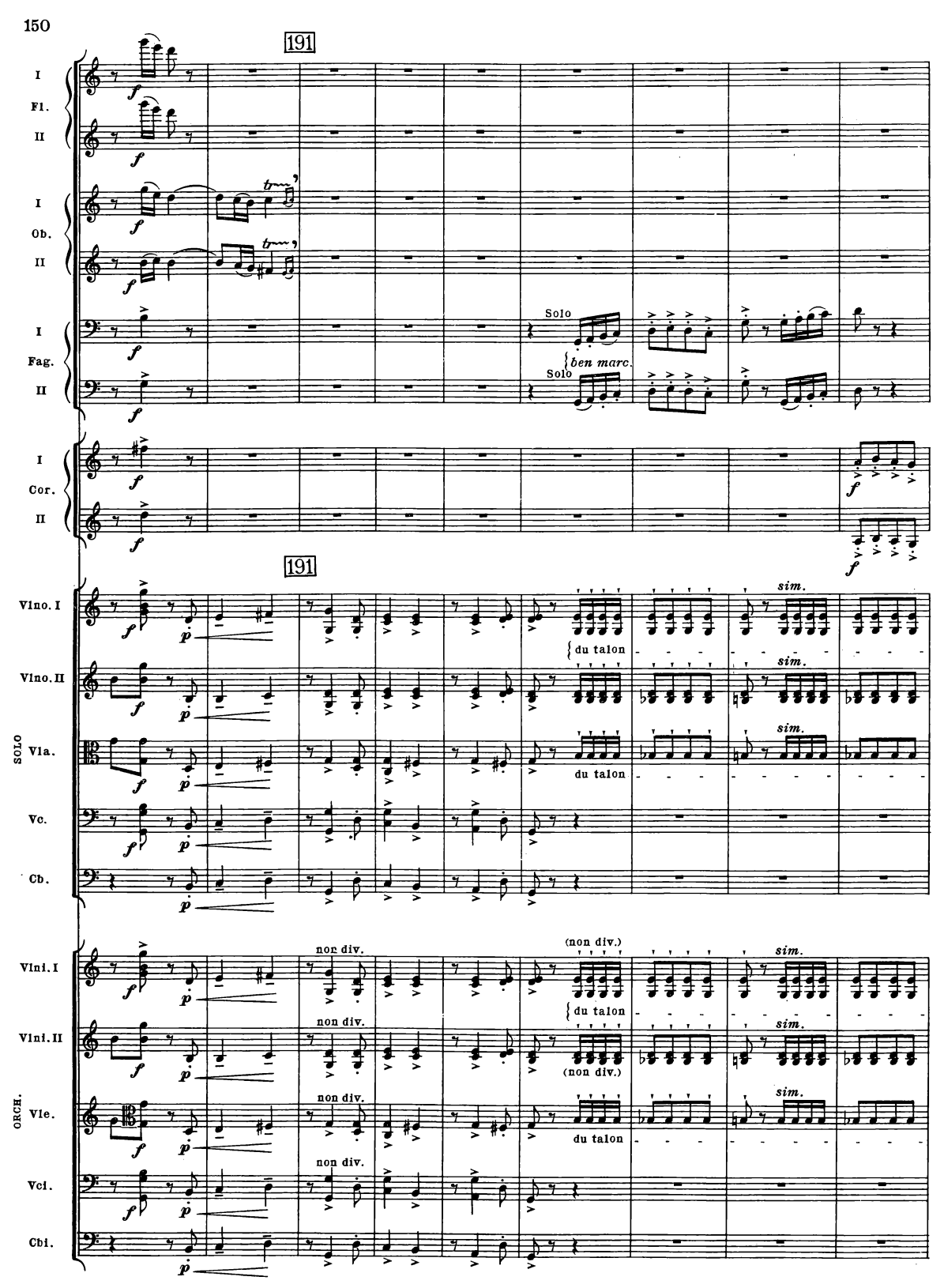
B. & H. 19362