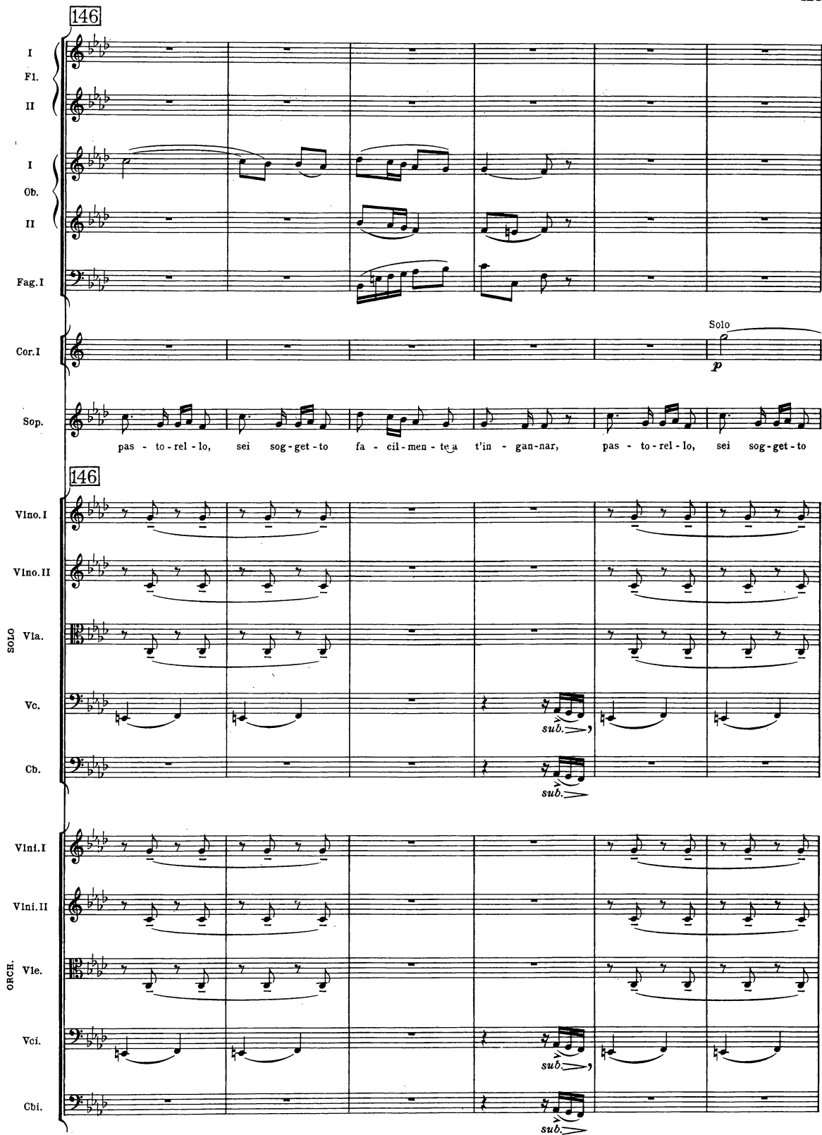
B. & H. 19362