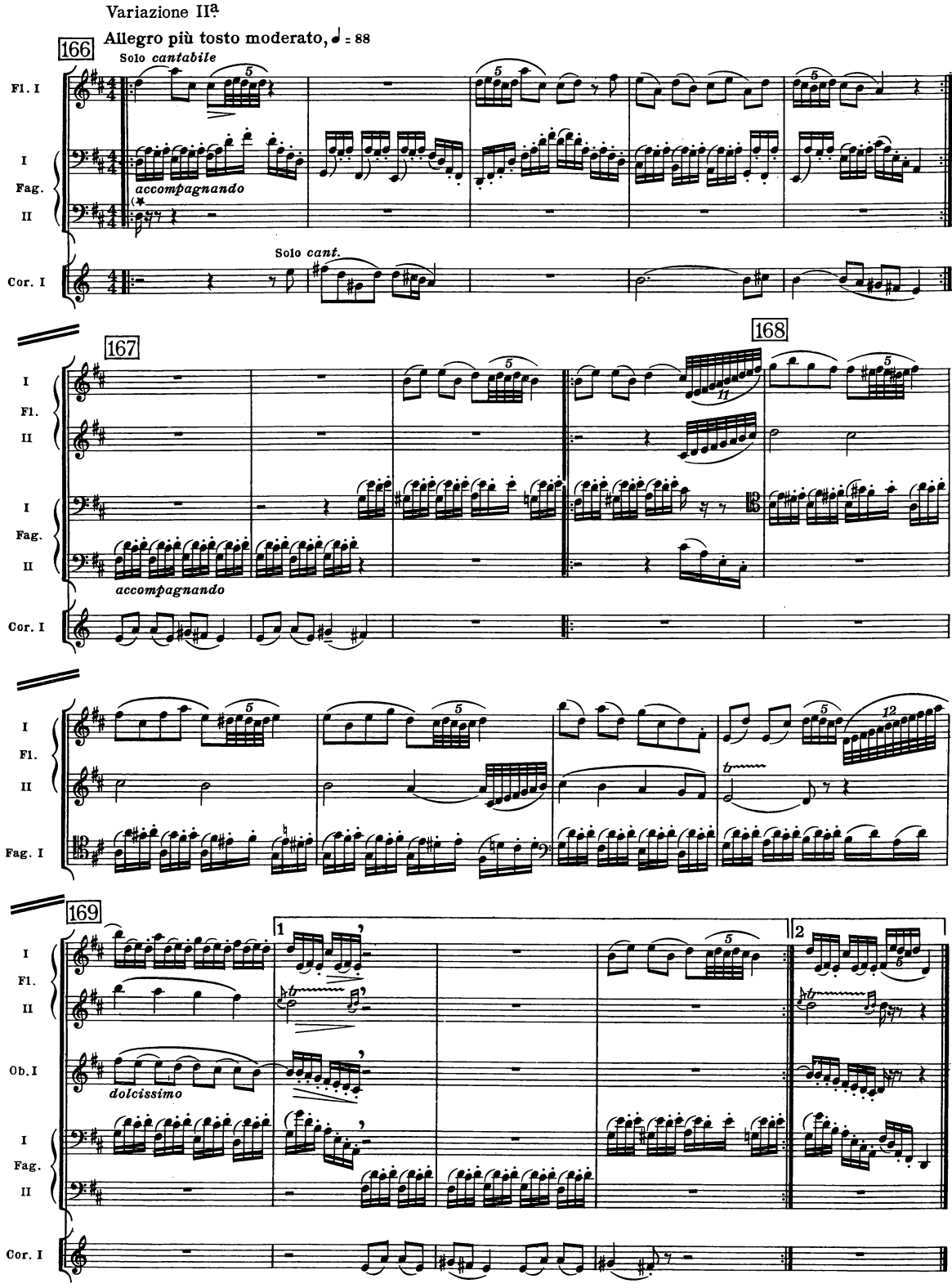
*) 1st time only; 2nd time Fag. II tacet