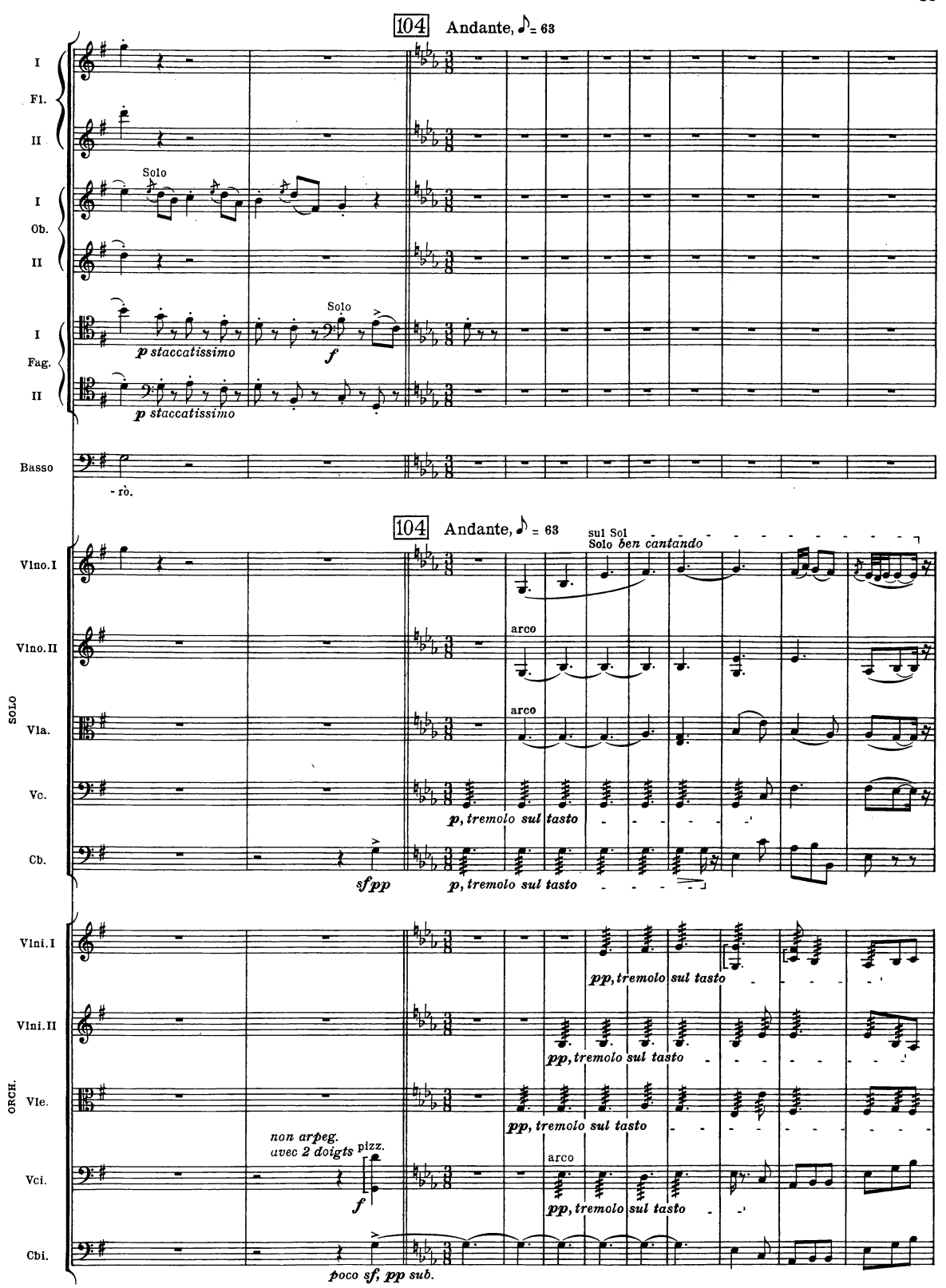
B. & H. 19362