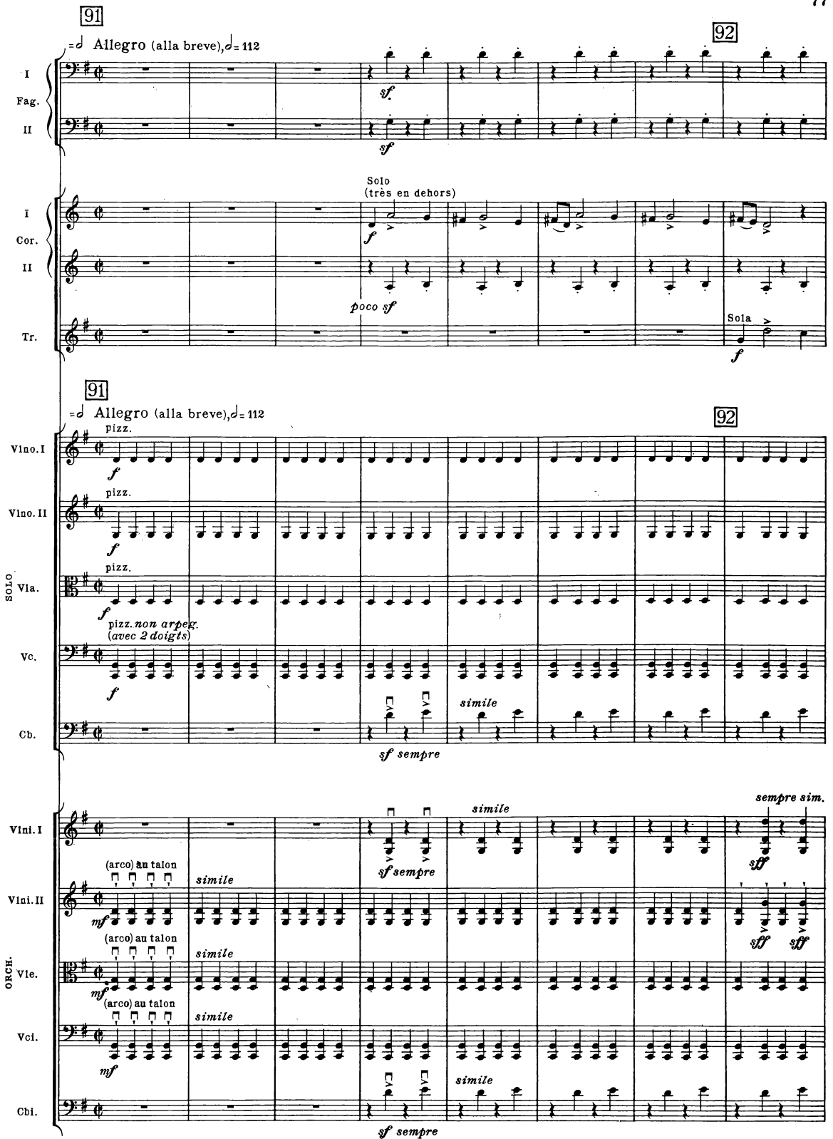
B.& H. 19362