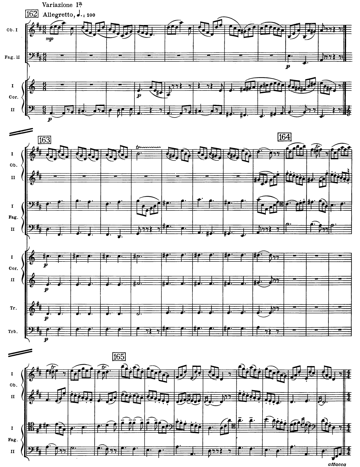
B. & H. 19362