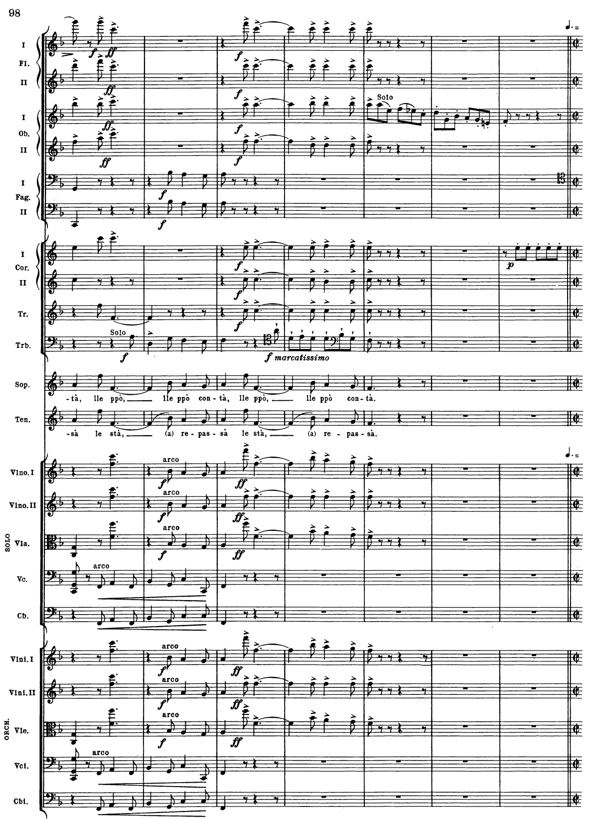
B. & H. 19362