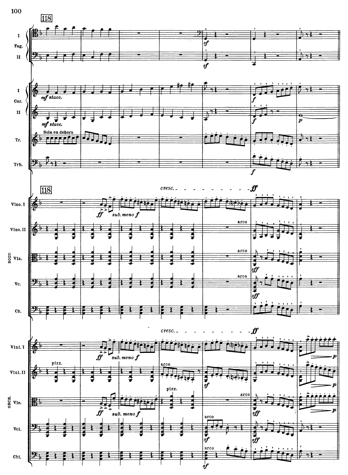
B.& H. 19362