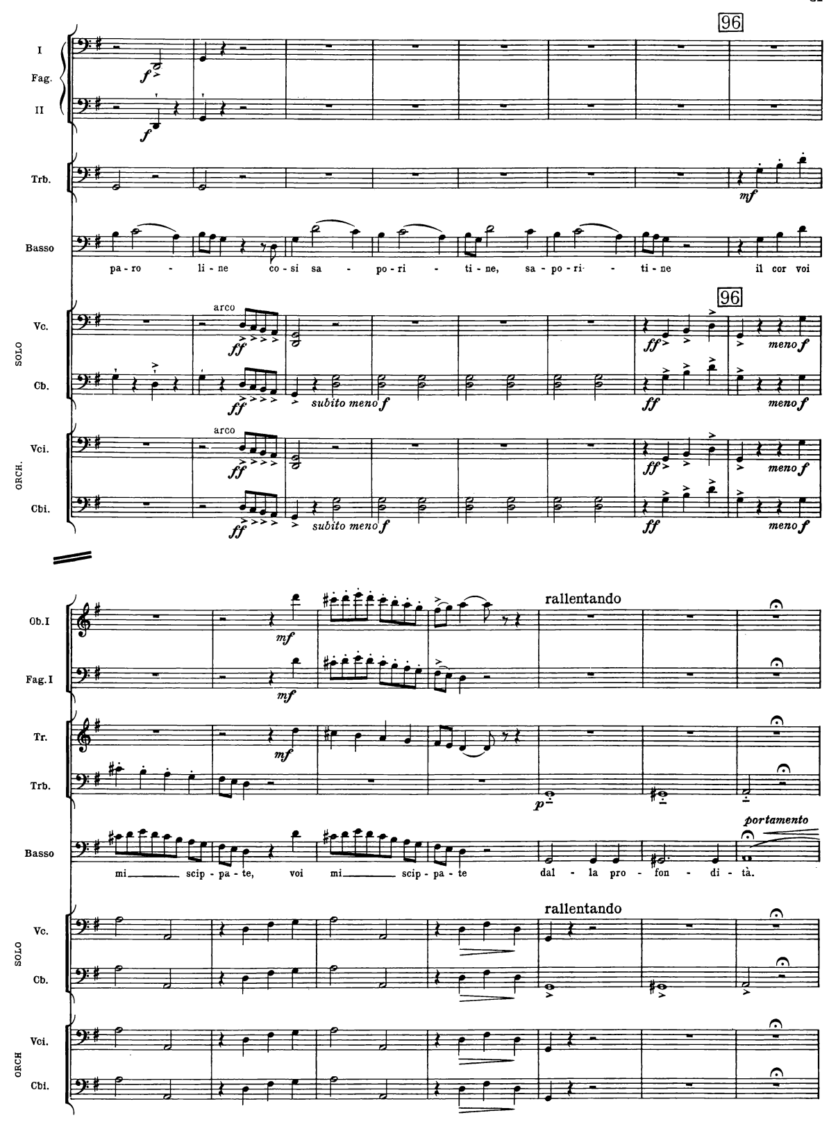
B. & H. 19362