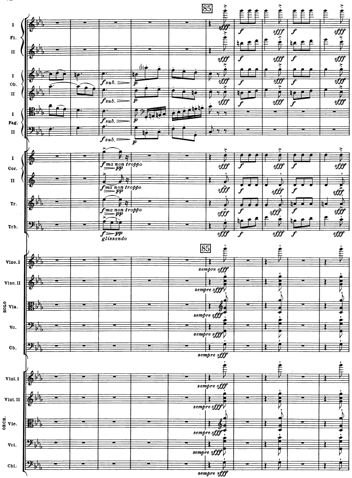
B. & H. 19362