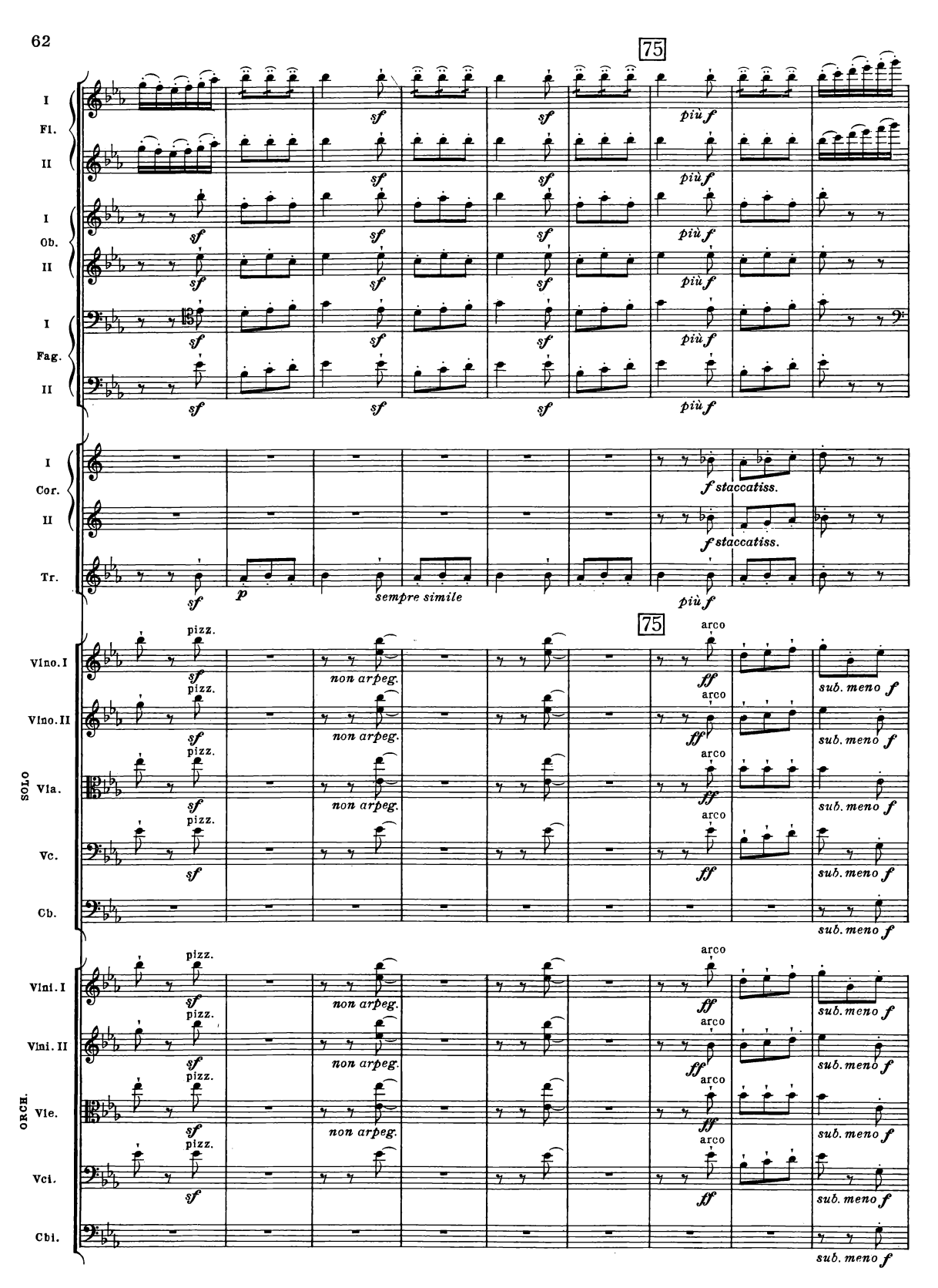
B. & H. 19362