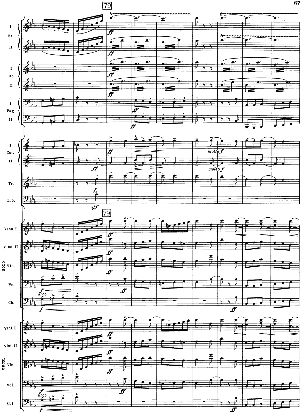
B. & H. 19362