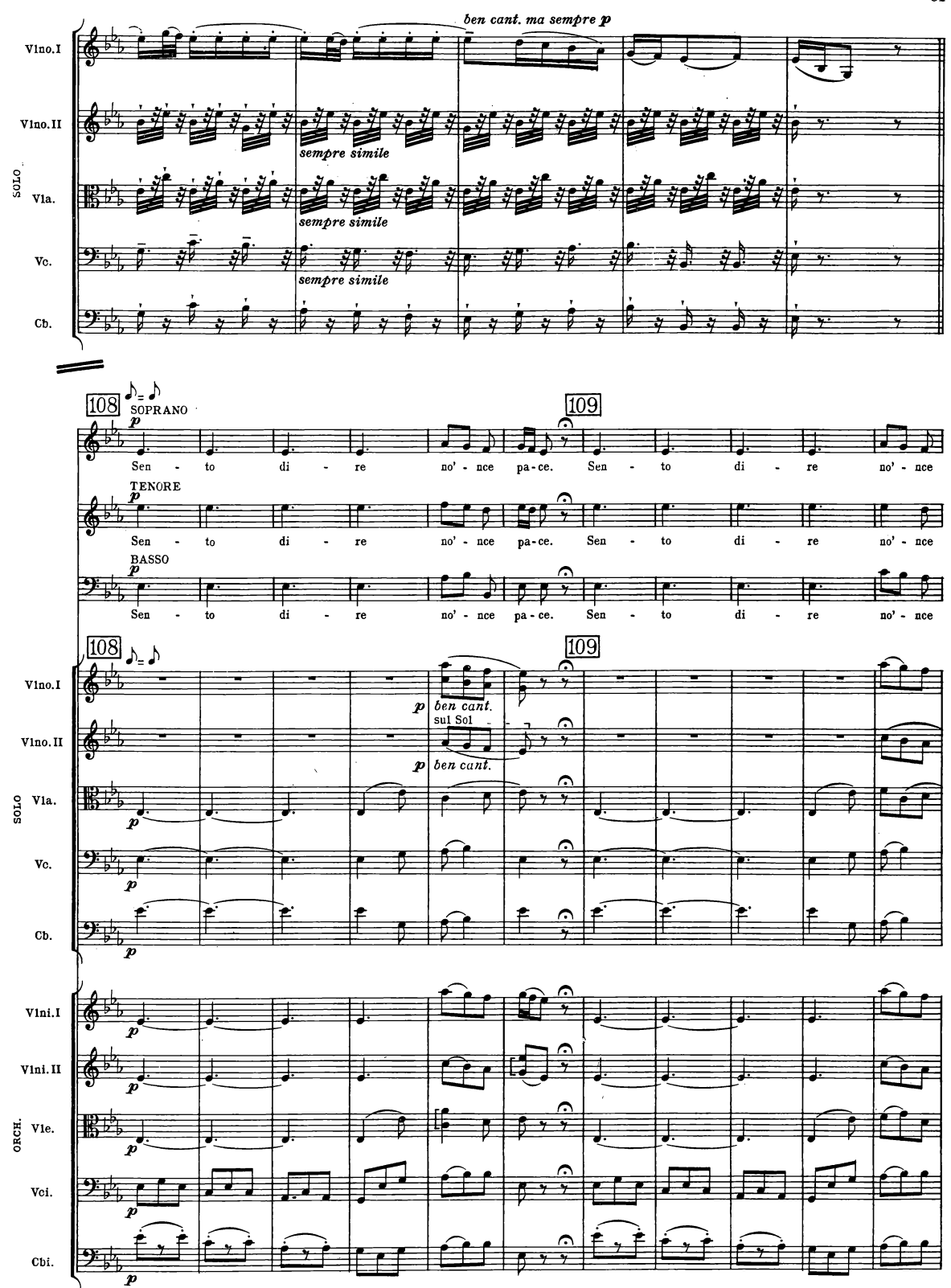
B. & H. 19362