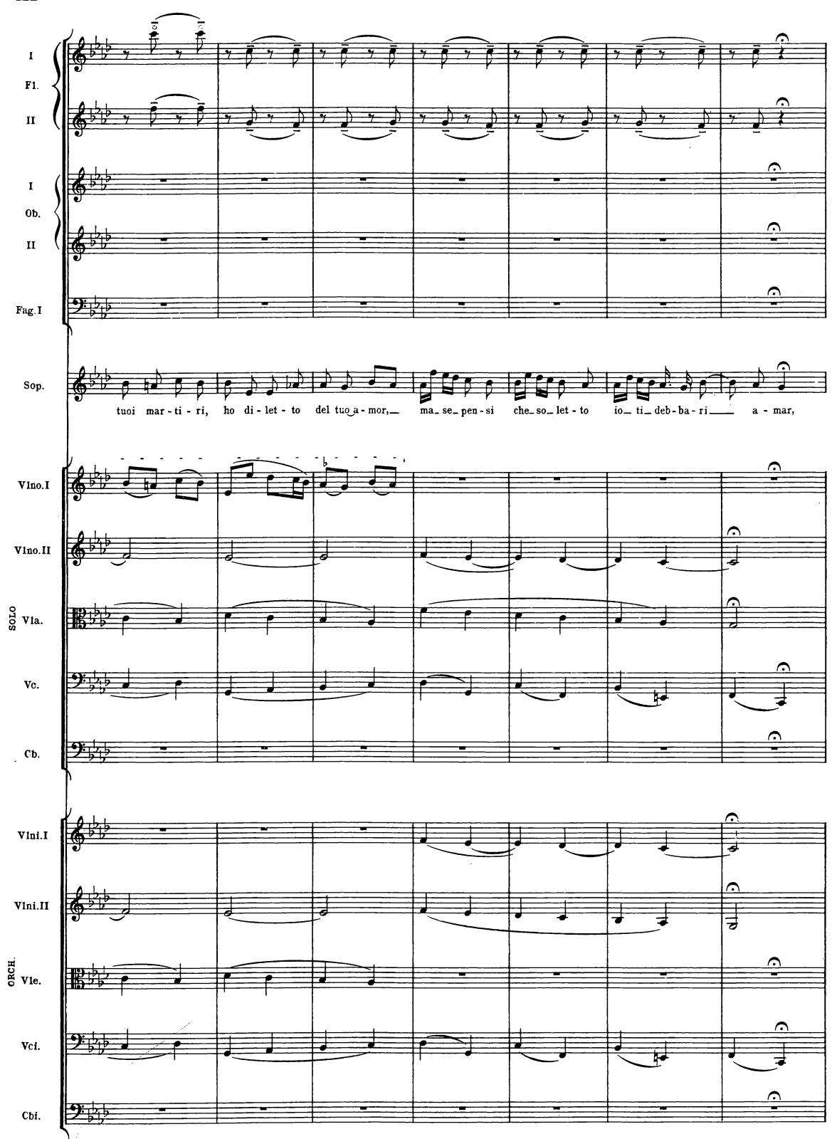
B. & H. 19362