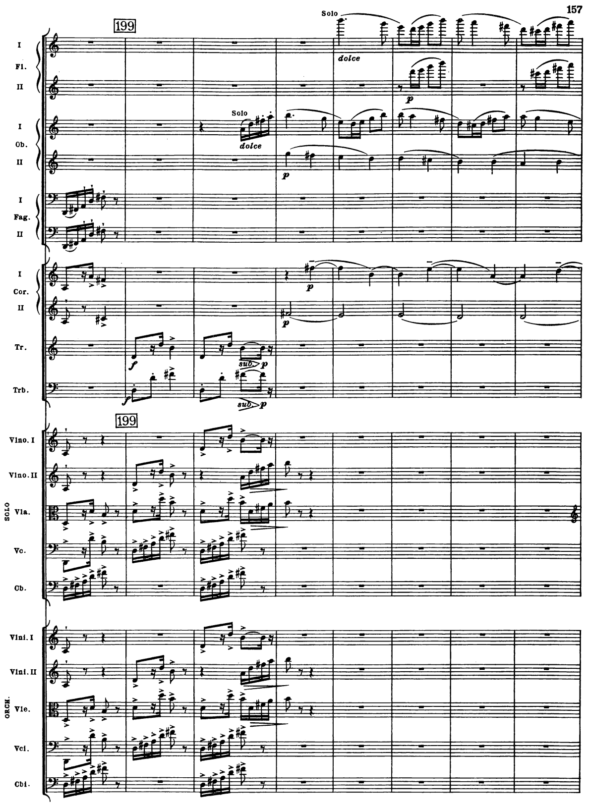
B. & H. 19362